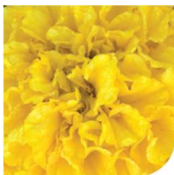
Pinnacle W0720 / D