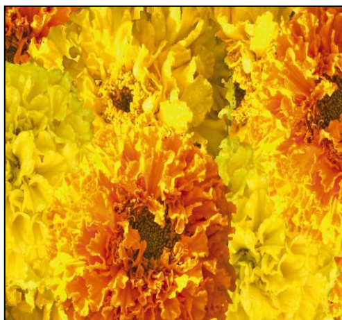
Guys and Dolls Mix W0740 / D