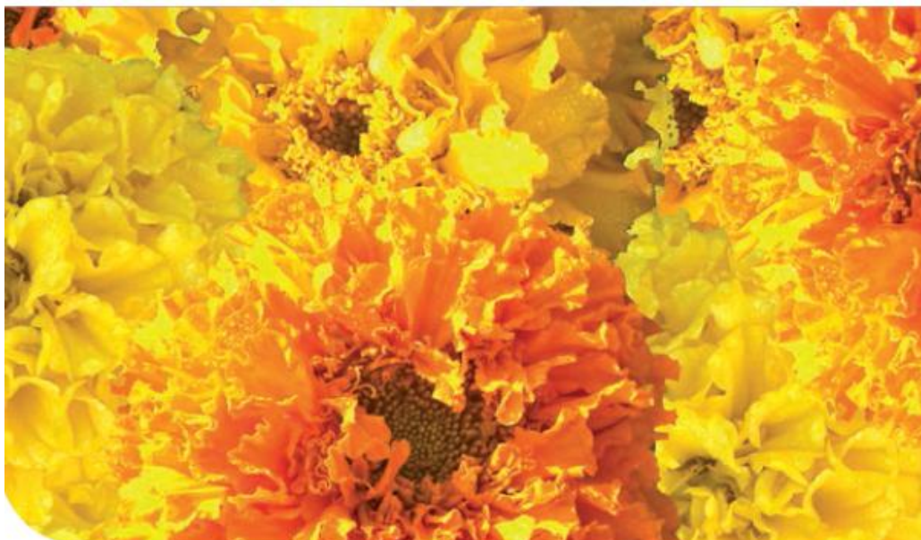
Guys and Dolls Mix W0740 / D