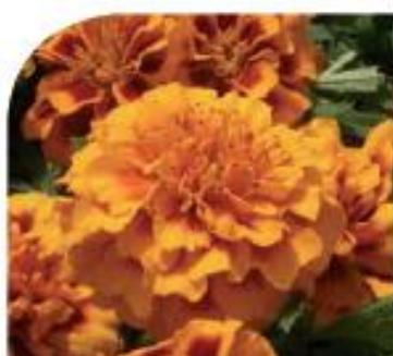
Orange Bee W1961 / D / C