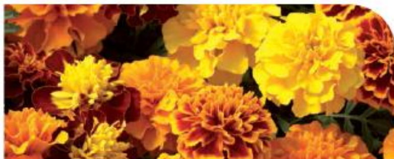
Mix W2071 / D / C