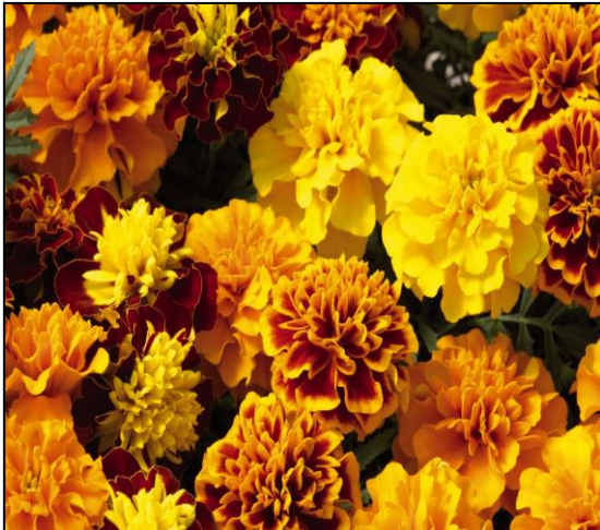
Mix W2071 / C / D