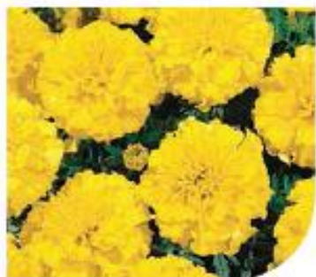
Yellow W2041 / D / C