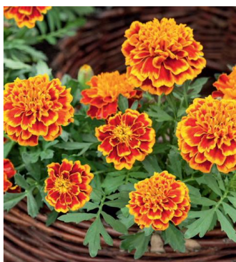
Flame W1921 / D / C