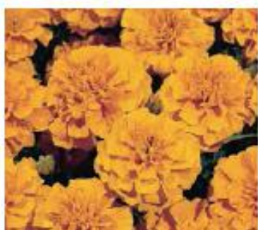
Orange W1981 / D / C