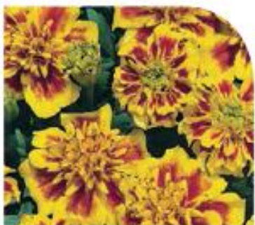
Bee W1901 / D / C

V nabídce v 8 čistých barvách a směsi (W2071 / C / D).