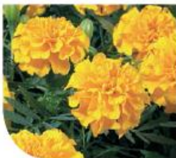
Gold W1941 / D / C