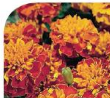
Harmony W1951 / D / C